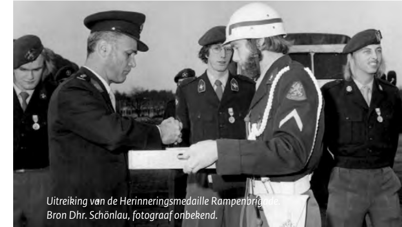
Uitreiking van de Herinneringsmedaille Rampenbrigade.