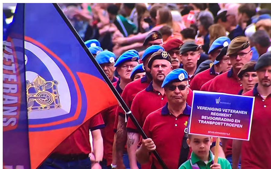
Foto's Bevrijdingsdefilé: screenshots reportage Bevrijdingsdag TV Gelderland

Aan dit defilé namen 29 veteranen van ons Regiment deel. Vooraf werd, nadat iedereen welkom was geheten door de verenigingsvoorzitter en -secretaris, Regimentscommandant en en -adjutant, in de siertuinen van het 'Belmonte Arboretum' - de verzamelpaats voor detachementen - nog even kort stilgestaan bij de achtergronden van deze herdenking door onze Regimentscommandant. Dit werd afgesloten met een toast op ons mooie Regiment.