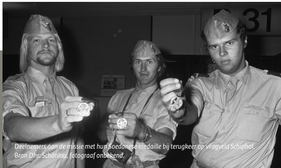
Deelnemers aan de missie met hun Soedanese medaille bij terugkeer op vliegveld Schiphol.

[Omdat Defensie en de Sectie Onderscheidingen spreken over de "Local Government Medal" zal ik in dit artikel deze Engelse benaming aanhouden.]