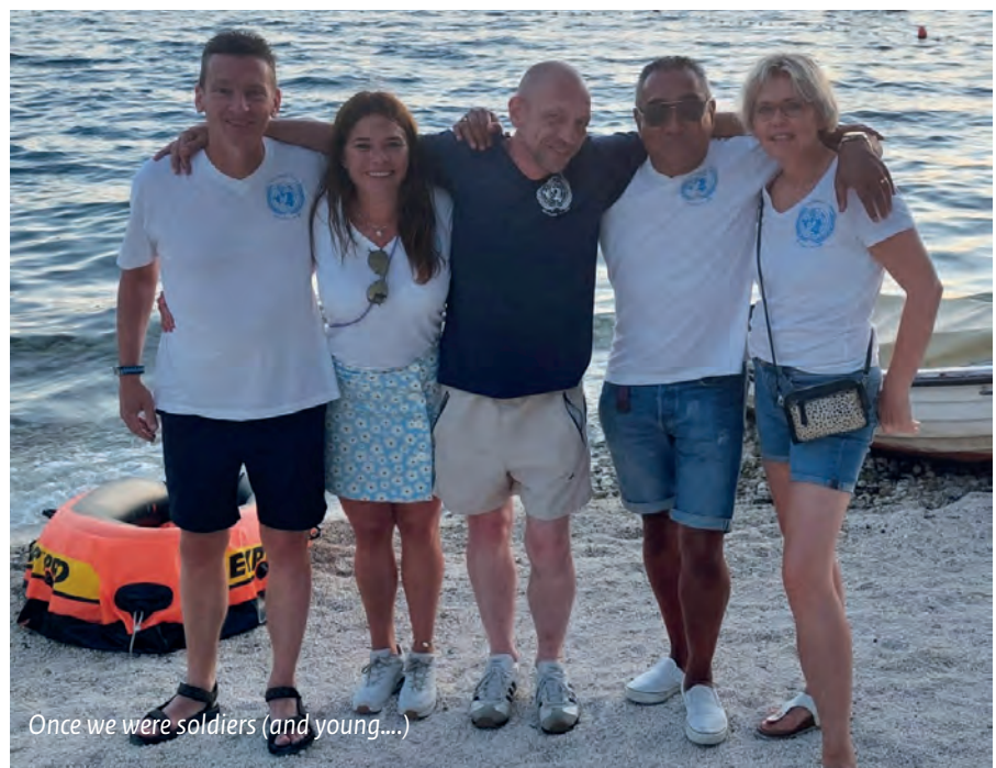
Once we were soldiers (and young...)

Rest mij nog 1 ding en dat is mijzelf af te melden: "Romeo hier Echo, ik meld mij uit het net, uit".