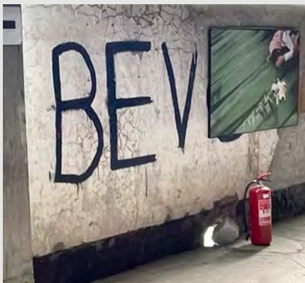
B&T, All the way!

Wij vervolgen onze weg en zakken via Sarajevo en de toenmalige compound van Malbat in Jablanica, af naar Mostar. In Mostar is de volgende overnachting. Hier bezoeken wij de gerepareerde 'Stari Most' over de Neretva-rivier. Het toerisme viert hier hoogtij en toch zijn de gevolgen van de oorlog nog altijd zichtbaar.